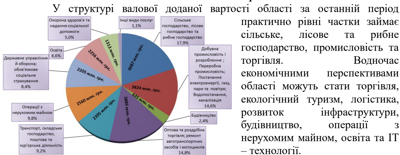
Рис.1 Структура валової доданої вартості Закарпатської області